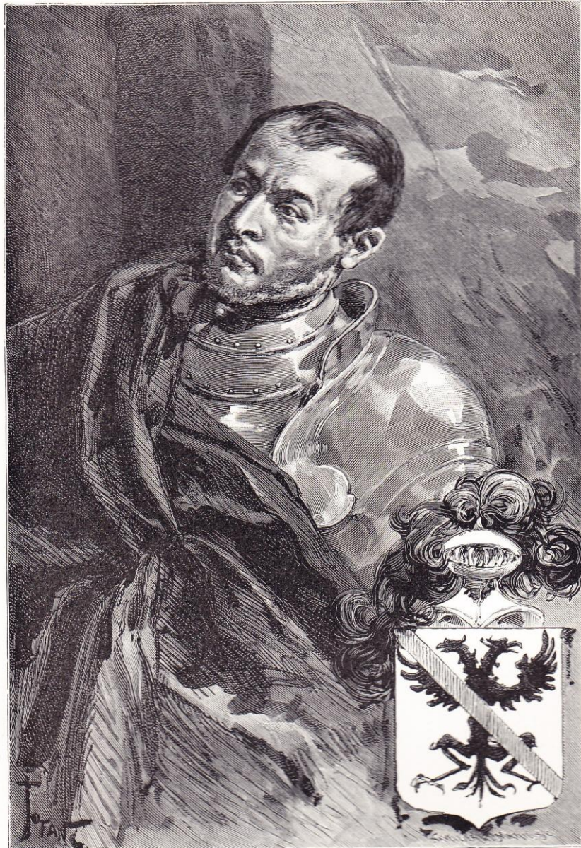
BERTRAND DU GUESCLIN